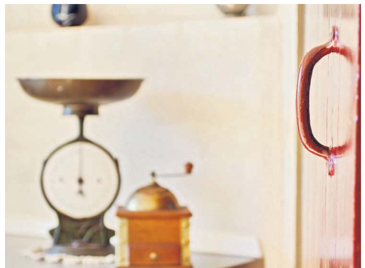
Nostalgisk køkkennips er en del af indretningen.