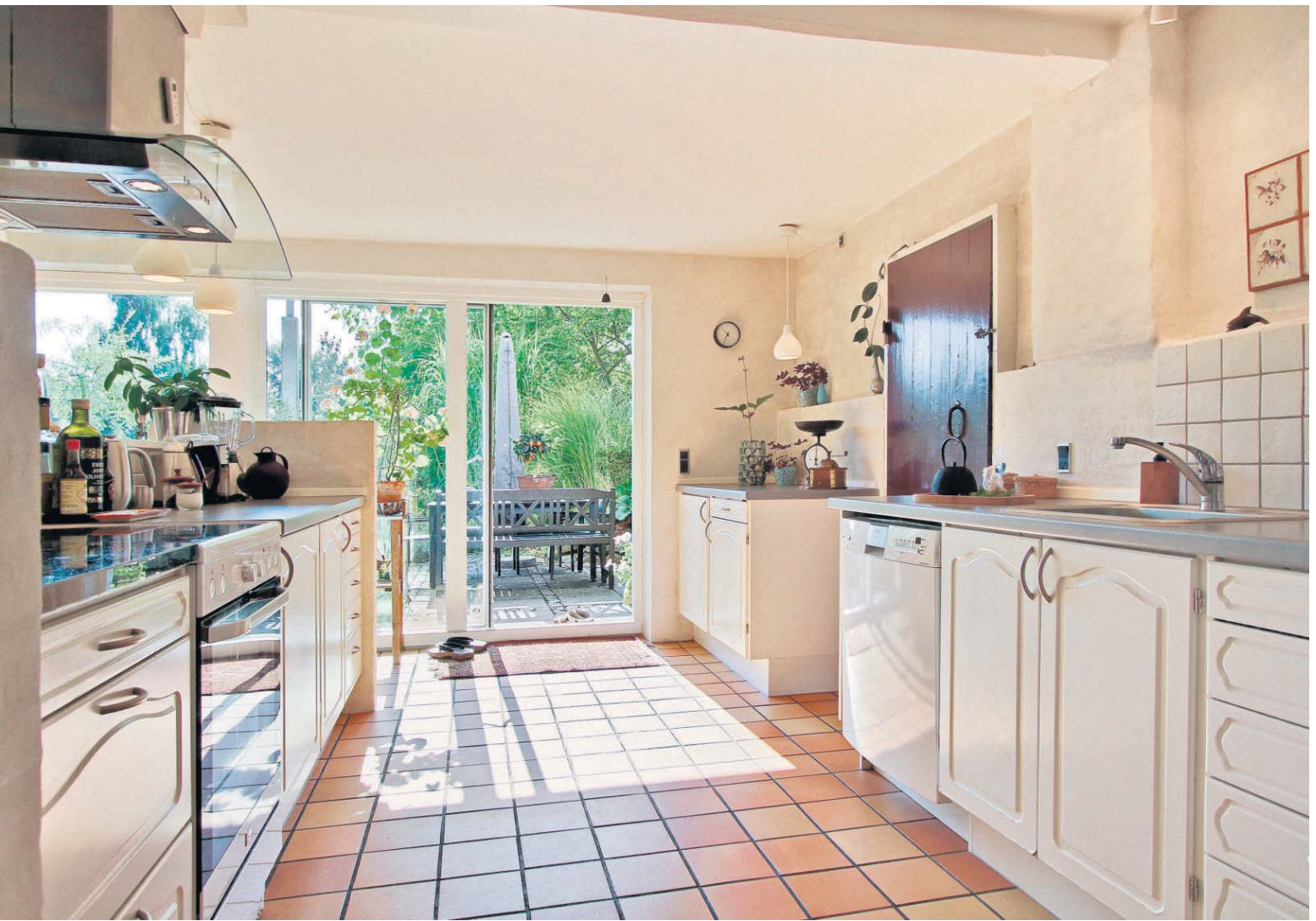
Køkkenets oprindelige elementer blev opbevaret under ombygningen og genbrugt i en ny indretning. Rammerne er bevidst bevaret i en rå stil med murede vægge og et rustikt Höganas-klinkegulv.