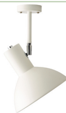
TRAGTEN E27 6,5W RA+diode