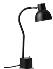
BORDBOBLEN 10+2W ACLdiode, driver på ledning