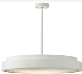
NANO up/down Indbygget forkløbling, 2 x 36W kompaktør.